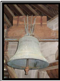
La cloche classée