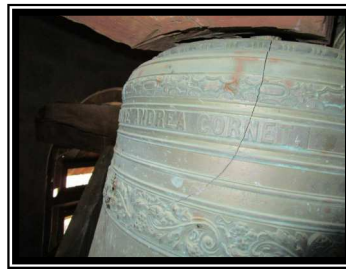
Une cloche fendue

Bien sûr, tout cela représente un coût ; à savoir 26 005 € HT. Ces travaux (soutenus financièrement par l'Etat, la Région et Département) peuvent faire l'objet d'une opération de mécénat culturel (appel aux dons).