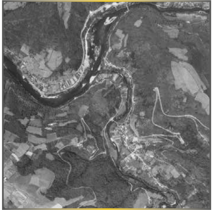
1981 - Le bourg de Grand-Vabre se structure le long de la D901, la route en direction de Vielmont est particulièrement visible.