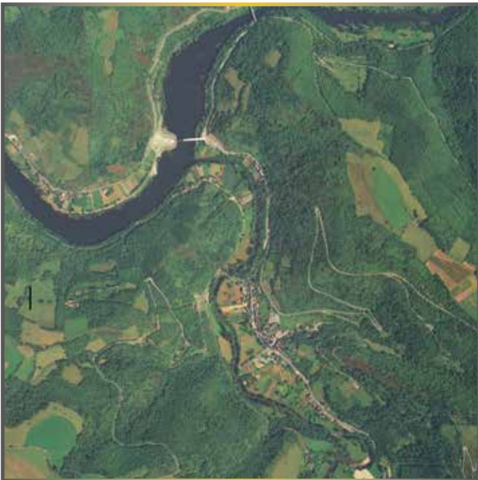
1992 - Le pont rejoignant la D42 est construit permettant une connexion vers le Cantal et le Lot.