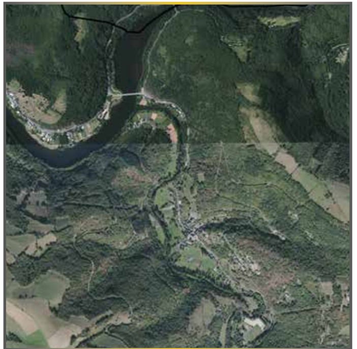
2019 - Le secteur des Pelies s'urbanise. La zone d'activités des Viourières accueille plusieurs entreprises. Le camping Grand Vabre Nature étoffe l'offre touristique du territoire. Observez l'évolution du couvert forestier au fil des années.