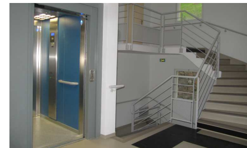
Chaque niveau est desservi par un ascenseur