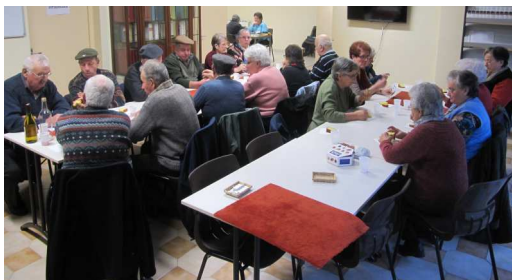
Après-midi rencontre/jeux 2 fois par mois à la Résidence

La commune ne compte pas moins de 12 associations dans plusieurs domaines : 3 e âge (qui organise chaque mois 2 après-midi rencontre/jeux au sein de la résidence), animation, sport, culture, patrimoine, chasse, école, tourisme, services.