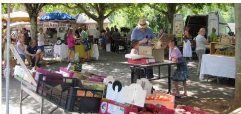
Le marché du dimanche matin, l'été.

Le Syndicat d'Initiative est chargé de faire connaître GRAND-VABRE et son petit patrimoine.