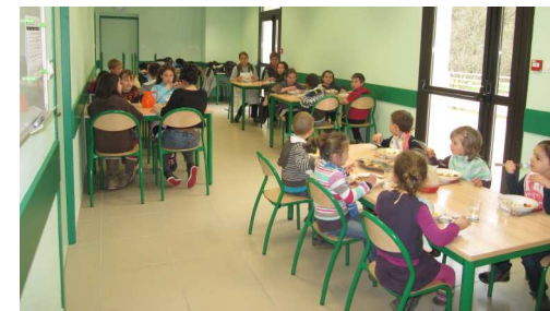
Le réfectoire destiné à la cantine scolaire est également accessible aux résidents