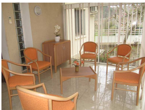
Un espace détente commun

Habitat conçu pour conserver une vie sociale riche avec des liens intergénérationnels tout en permettant de vivre dans son environnement, apporter un climat de sécurité et faciliter les interventions à domicile (aide à domicile, infirmières, service de soins, assistantes sociales...). Le résident continue à faire appel à son médecin traitant, aux professionnels de santé locaux et au service d'aide à domicile de son choix.